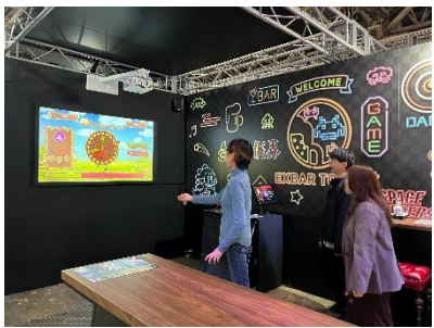
AR DARTS (エーアールダーツ)

ダックピン＝アヒルの様な小さなピンで、誰でも気軽に楽しめ、レーンにマッピングされた特別なゲームを楽しむ事も出来ます。