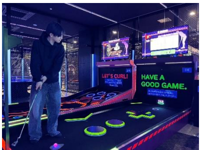
PUTT GOLF (パットゴルフ)

競技ではなくアミューズメントとして友人や家族、グループで楽しむことができ、自動スコアリング、複数のスキルレベル設定が可能で、国内初登場。