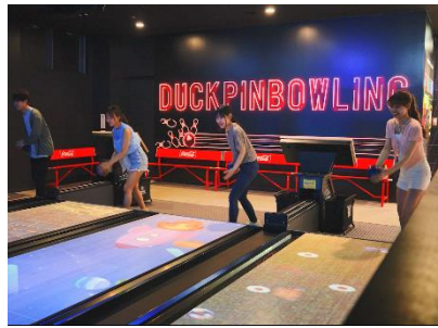
DUCKPIN BOWLING (ダックピンボウリング)