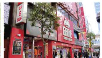
タイトーステーション 新宿南口ゲームワールド店