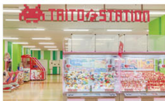
タイトーFステーション ニューコースト新浦安店