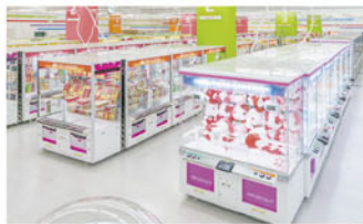
タイトーステーション 府中くるる店