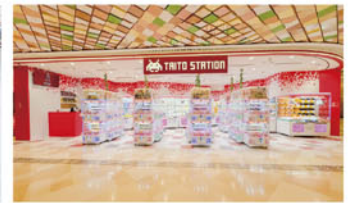
タイトーステーション V Walk 店 (香港)