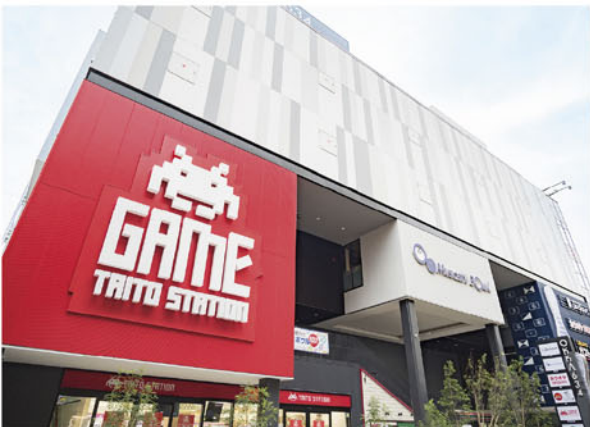
タイトーステーション 溝の口店