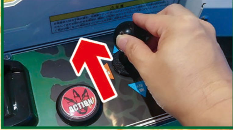
レバー上でクレジットのメダル発射