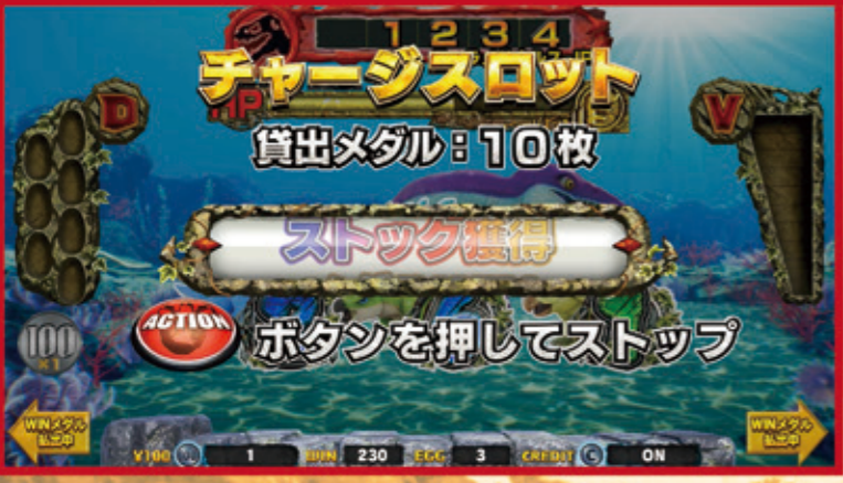
ゲーム中に100円投入でメダル貸出+チャージスロット!