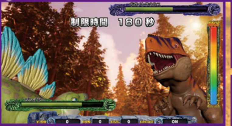
定期的に全サテライト参加のイベントゲーム発生!