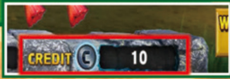
獲得メダルはクレジットに加算。