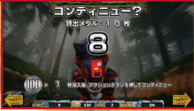
ミニゲーム時は貸出+ミニゲームコンティニュー